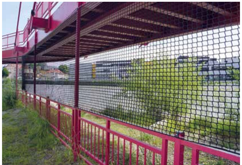
Das Ballfangnetz in der Griesrechenbucht.

Die Griesrechenbucht den Kindern als Spielfläche zur Verfügung zu stellen, war schon seit längerem im Gespräch. Um zu verhindern, dass Bälle von der Bucht in die Salzach gelangen, wurde nach einer optisch ansprechenden Lösung gesucht. Dabei wurden drei mögliche Varianten geprüft: ein Meshnetz (bedrucktes Banner) ein Ballfangnetz und ein Ballfangzaun. Unter Berücksichtigung von der optischen Wirkung, der Praxisgerechtigkeit und der Kosten wurde die Ausführung eines Ballfangnetzes gewählt. Auf jeden Fall sollte die Sicht auf die Salzach gegeben sein, Hochwasserereignisse dürfen keine Auswirkungen auf das Netz haben und die Kosten mussten sich natürlich im Rahmen halten. „Auch wenn wir uns eine frühere Umsetzung gewünscht ha-