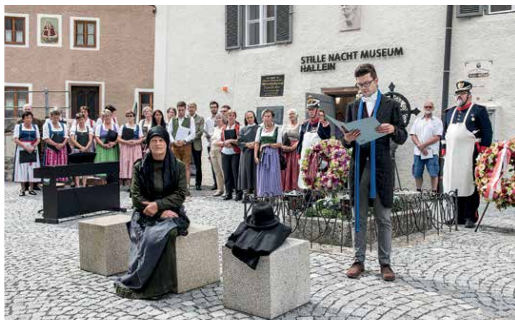
Beim „Tag der offenen Tür“ im neuen Gruber-Haus las Felix Gruber (Benjamin Huber) aus den Briefen seines Vaters. Die dritte Ehefrau Katharina (Brigitte Winkler) hörte gespannt zu.

Die nachhaltige Nutzung des Gebäudes als Museum erforderte eine moderne Infrastruktur und eine barrierefreie Erschließung. Ein Aufzug verbindet nun die drei Geschosse und in den Stockwerken wurden die Bodenniveaus angeglichen. Bei den Adaptierungsmaßnahmen wurden der Grundriss und die Baustruktur des Gebäudes erhalten, die Wandoberflächen an der Fassade und im Inneren, Gewölbe und historische Böden weitestgehend restauriert. Wichtiges Kriterium bei den Umbaumaßnahmen war eine gute Abstimmung zwischen